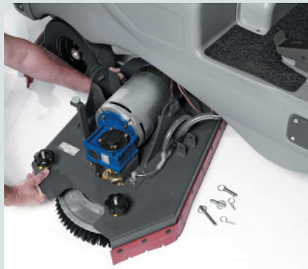
El sistema QuickChange™ es intercambiable sin necesidad de herramientas