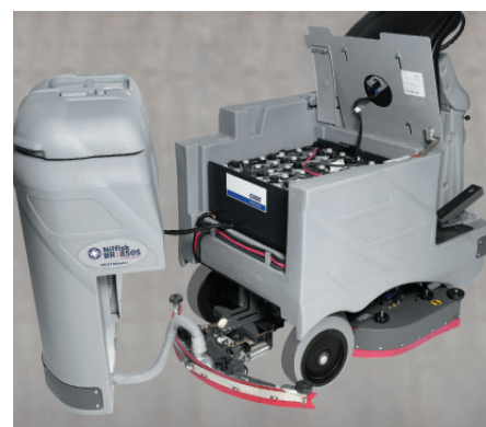
Panel de control fácil de usar