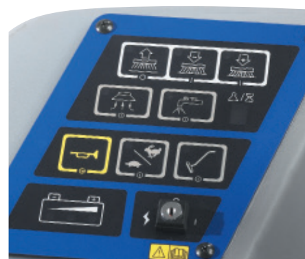
El fácil acceso a todos los componentes clave facilita el servicio técnico