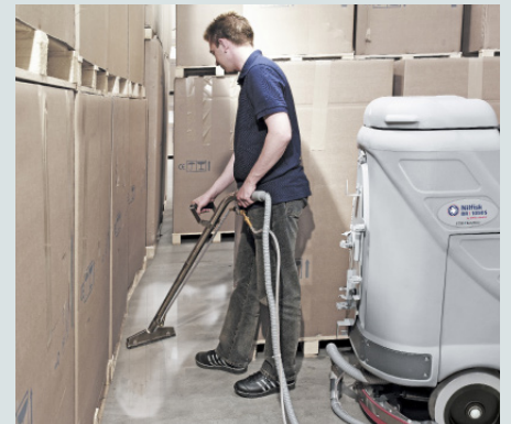
Esta máquina compacta ofrece un alto nivel de productividad y eficiencia en grandes zonas industriales