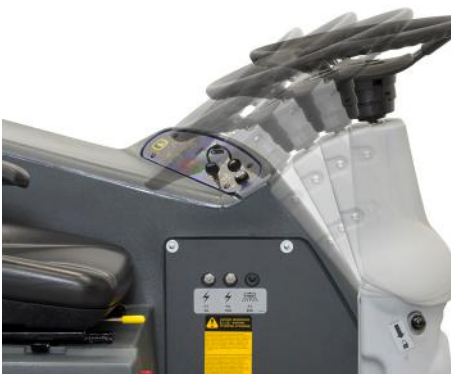
Volante inclinable que ofrece una mayor comodidad al operario al usarlo o al subirse a la máquina, compartimento ergonómico pensado en el confort y la seguridad del operario.