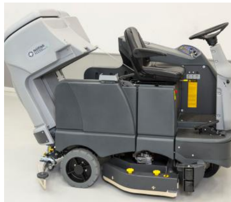
Depósito de agua sucia basculante.