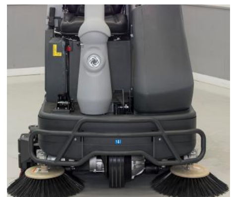
Doble cepillo lateral (modelo cilíndrico) para poder limpiar los bordes a la perfección.