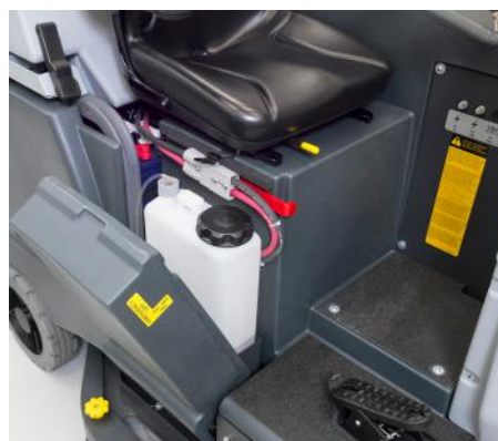
Kit Ecoflex (opcional): acceso más fácil a las garrafas de detergente.