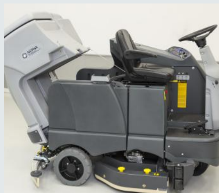
Depósito de agua sucia basculante.