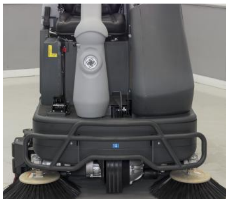
Doble cepillo lateral (modelo cilíndrico) para poder limpiar los bordes a la perfección.

El excepcional sistema Ecoflex permite al operador combinar el rendimiento de limpieza de la máquina con el tipo de suciedad y el nivel de limpieza necesario para cada suelo. Cuando se encuentre áreas sucias, el operador podrá activar el botón de máxima potencia para una limpieza extra y después es muy sencillo volver a los ajustes originales para un menor uso de agua y de detergente. Green meets clean.