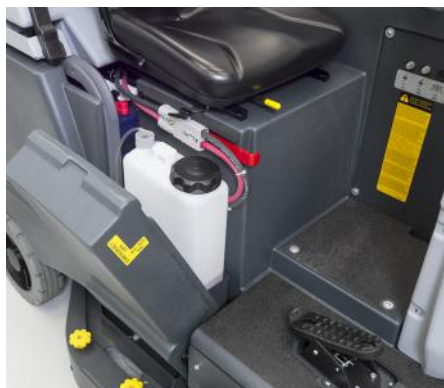
Kit Ecoflex (opcional): acceso más fácil a las garrafas de detergente.