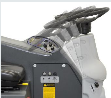
Volante inclinable que ofrece una mayor comodidad al operario al usarlo o al subirse a la máquina, compartimento ergonómico pensado en el confort y la seguridad del operario.