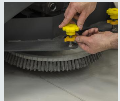
Utilidad: Nuevo motor sin escobilla y sin mantenimiento, reductora de alta calidad y pomo para ajuste en amarillo.