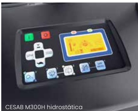
CESAB M300H hidrostática

La CESAB M300H Stage V incorpora de serie una pantalla con todas las opciones que muestra al instante toda la información relevante. Durante el arranque, la pantalla muestra el estado de la carretilla, desde el ángulo de inclinación del mástil hasta la posición del volante. Esto ayuda al conductor a prepararse para una conducción segura.